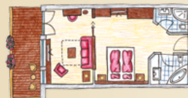
Comfort "Alpine" 30 m 2

Suite con zona soggiorno e camera da letto separata, splendida vista con balcone rivolto a sud, 2 bagni indipendenti con vasca deluxe, asciugacapelli, cassaforte, telefono, collegamento a internet, minibar, TV a schermo piatto, pavimento in legno, specchio a ingrandimento in bagno. Per 2-5 persone.