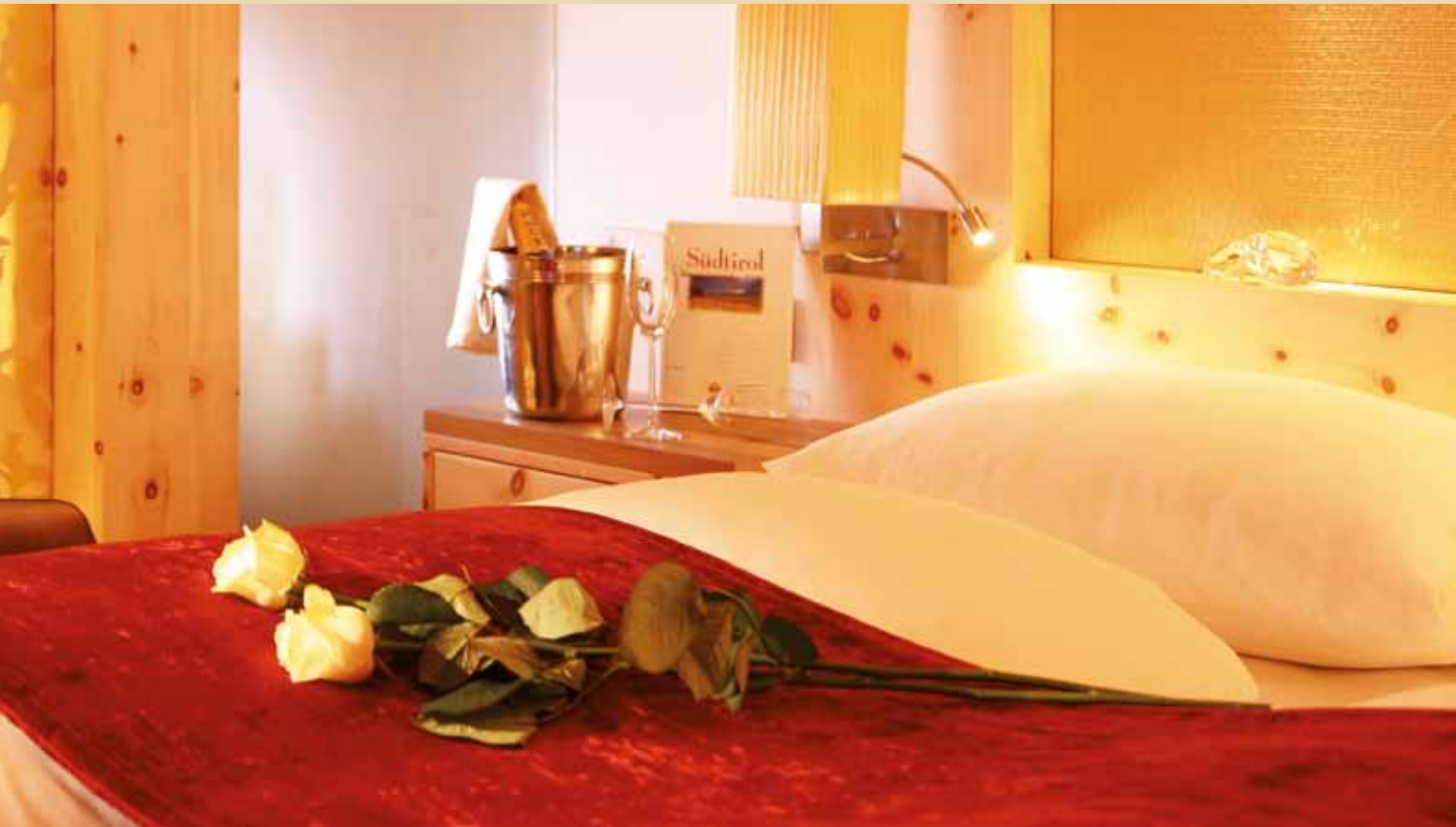
"Bella Vista" Suite 50 m 2